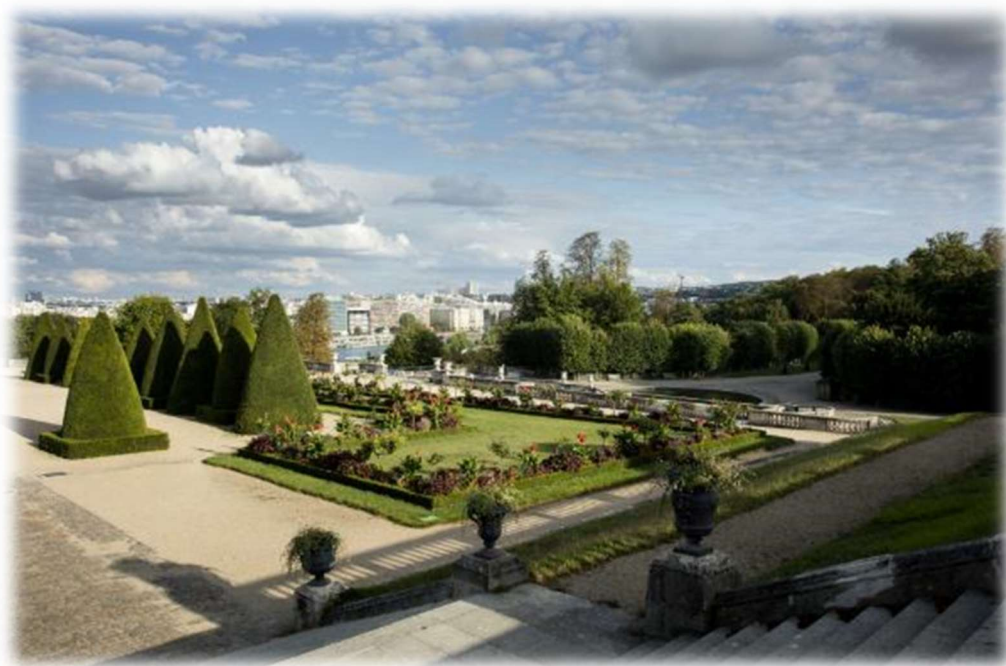
Domaine national de Saint-Cloud, terrasse du château

Convention d'occupation domaniale Procédure de sélection en application de l'article L. 2122-1-1 du CG3P