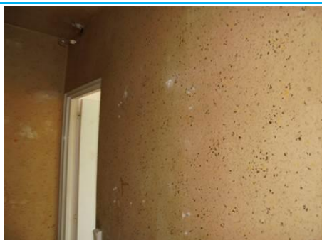
Ouvrage : 3 - Parois verticales intérieures - Murs et cloisons maçonnés Partie : Enduit à base de plâtre lissé ou taloché Description : Enduit mur de refend Localisation : 1er Etage - Entrée; 1er Etage - Rangement