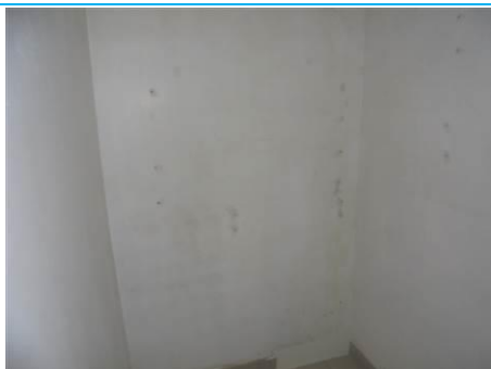
Matériaux : ZPSO-001 Prélèvement : P001; P002 Description : Enduit sur mur béton périphérique Localisation : RDC - Rangement Résultat : Absence d'amiante