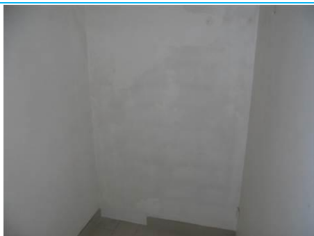
Matériaux : ZPSO-001 Prélèvement : P001; P002 Description : Enduit sur mur béton périphérique Localisation : 2 ème Etage - Rangement Résultat : Absence d'amiante