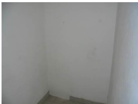
Matériaux : ZPSO-001 Prélèvement : P001; P002 Description : Enduit sur mur béton périphérique Localisation : 1er Etage - Rangement Résultat : Absence d'amiante