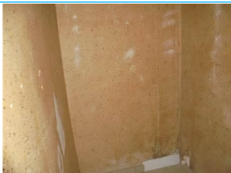
Matériaux : ZPSO-001 Prélèvement : P001; P002 Description : Enduit sur mur béton périphérique Localisation : 1er Etage - Rangement Résultat : Absence d'amiante