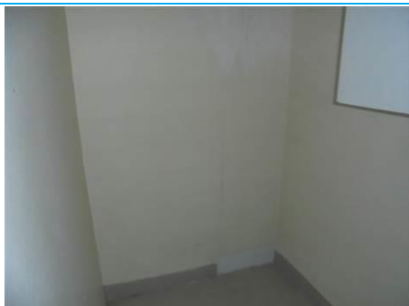
Matériaux : ZPSO-001 Prélèvement : P001; P002 Description : Enduit sur mur béton périphérique Localisation : RDC - Rangement Résultat : Absence d'amiante