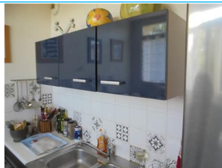
Matériaux : ZPSO-002 Prélèvement : P003; P004 Description : Enduits sur cloison plâtre Localisation : 2 ème Etage - Cuisine; 2 ème Etage - Salle de bain Résultat : Absence d'amiante