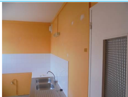
Matériaux : ZPSO-002 Prélèvement : P003; P004 Description : Enduits sur cloison plâtre Localisation : 2 ème Etage - Cuisine; 2 ème Etage - Salle de bain Résultat : Absence d'amiante