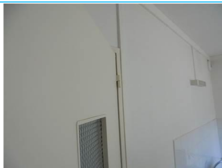
Matériaux : ZPSO-002 Prélèvement : P003; P004 Description : Enduits sur cloison plâtre Localisation : RDC - Cuisine; RDC - Salle de bain Résultat : Absence d'amiante