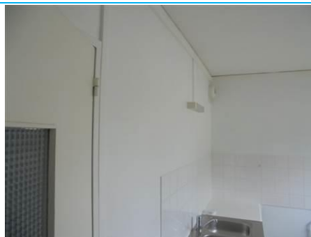
Matériaux : ZPSO-002 Prélèvement : P003; P004 Description : Enduits sur cloison plâtre Localisation : RDC - Cuisine; RDC - Salle de bain Résultat : Absence d'amiante