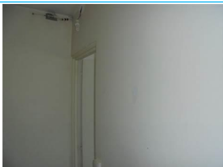
Matériaux : ZPSO-003 Prélèvement : P005; P006 Description : Enduit mur de refend Localisation : RDC - Entrée; RDC - Rangement Résultat : Absence d'amiante