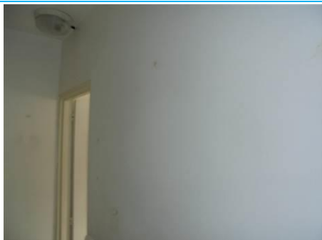
Matériaux : ZPSO-003 Prélèvement : P005; P006 Description : Enduit mur de refend Localisation : RDC - Entrée; RDC - Rangement Résultat : Absence d'amiante