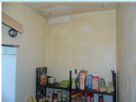
Matériaux : ZPSO-001 Prélèvement : P001; P002 Description : Enduit sur mur béton périphérique Localisation : 2 ème Etage - Rangement Résultat : Absence d'amiante