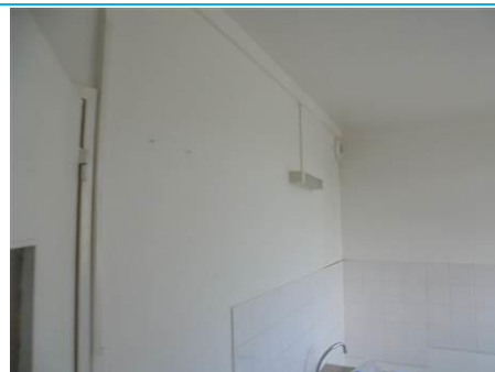
Matériaux : ZPSO-002 Prélèvement : P003; P004 Description : Enduits sur cloison plâtre Localisation : 1er Etage - Cuisine; 1er Etage - Salle de bain Résultat : Absence d'amiante