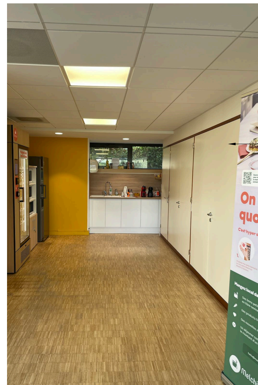
• Placard actuel

Les portes de placard seront repensées pour s’intégrer harmonieusement à l’agencement général. Elles seront réalisées toute hauteur, avec un cadre en bois d’une épaisseur de 3 cm et un remplissage en feutrine sur la face intérieure, apportant à la fois une finition soignée et un confort acoustique. Intégration d’une signalétique pour le placard contenant le TGBT à prévoir.