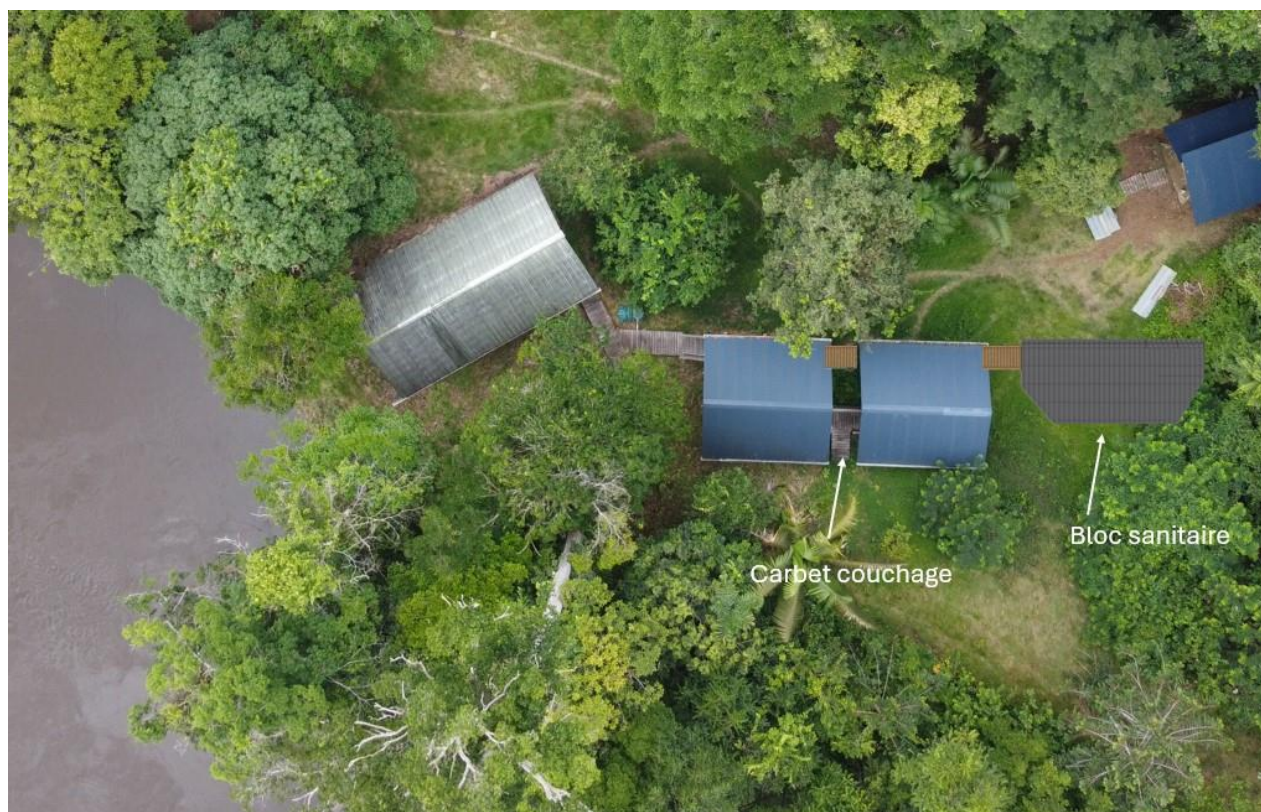
Plan de situation sur le camp